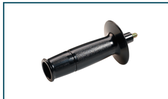
Handgreep M8 - 153489-2 - 0088381193054