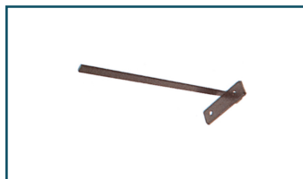
Breedtegeleider - 164095-8 - 0088381101080