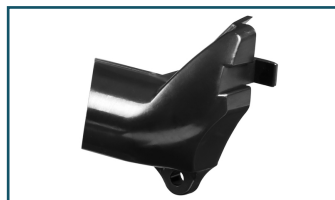
Stofafzuigadapter - 452091-1 - 3240890414007