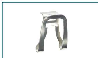
Draaghaak - 346317-0 - 3240890353641