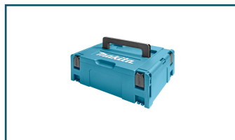
Mbox nr.2 - 821550-0 - 0088381430128