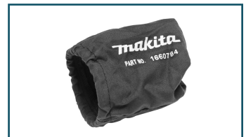
Stofzak "linnen" - 166078-4 - 3240890264640

Dit is slechts een kleine greep uit het ruime assortiment. Kijk voor alle accessoires/verbruiksartikelen in de Catalogus of op www.makita.nl .