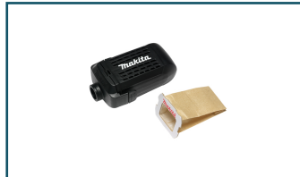
Stofbox+papieren stofzak - 135246-0 - 3240890284365