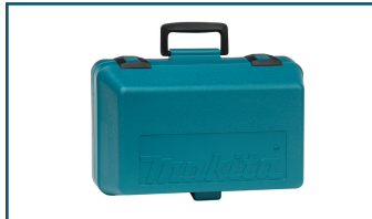
Koffer - 824806-0 - 0088381346092