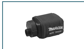
Linnen stofzak incl. adapter - 135222-4 - 3240890282941