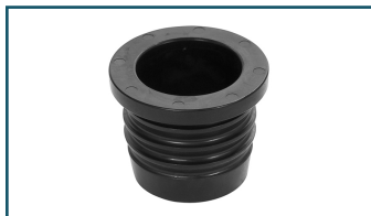
Adapter - 417408-5 - 0088381157872