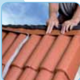
Foto links: LaRol toepassing op de nok. Foto rechts: Universele ruitterrol toepassing op de hoekkeper.

Breng de LaRol, Topvent of Universele ruitterrol aan op de ruitter. Het hart van de nagelband is hart van de ruitter. Bevestig de LaRol, Topvent of Universele ruitterrol op de ruitter met nieten in de nagelband.