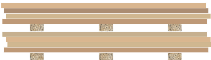
Afbeelding 1: Sla plaatmateriaal vlak en geventileerd op