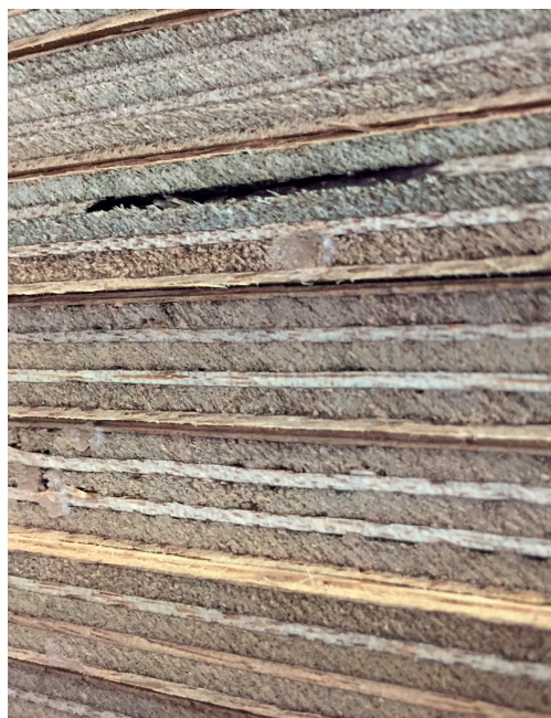
Afbeelding 3: Vul open gebreken met een vulmiddel